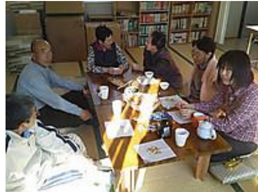
水浜集落のおちゃっこの様子