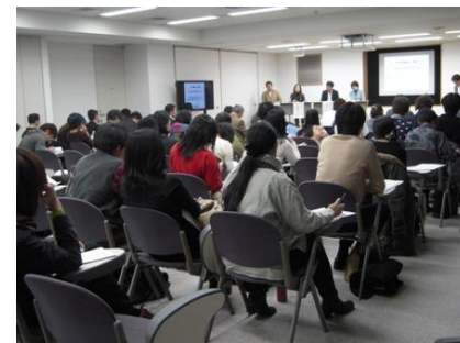
(右)つなプロ報告会@東京の様子