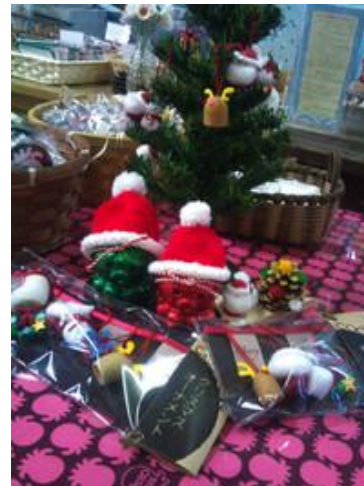
「南三陸町の名産である真蛸をモチーフとした復興グッズ、「オクトパス君」のクリスマスグッズ