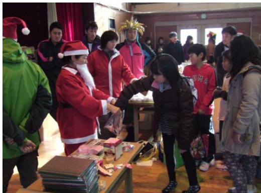
12月23日開催の親子クリスマスイベントの様子

★石巻復興支援ネットワークのHPもご参照ください： http://yappesu.jimdo.com/