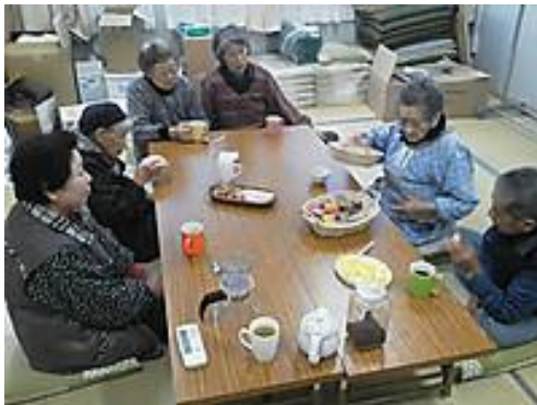
立浜集落のおちゃっこの様子

★しゃべっちゃプロジェクトのブログもご参照ください： http://sbcogatsu.blogspot.com/