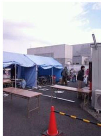
（左）国府多賀城駅南地区仮設住宅餅つき大会 （右）多賀城中学校仮設住宅餅つき大会

★「復興応援団」のHPもご参照ください→ http://www.fukkou-ouendan.com/