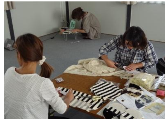
仮設団地集会所における生きがい内職仕事の様子