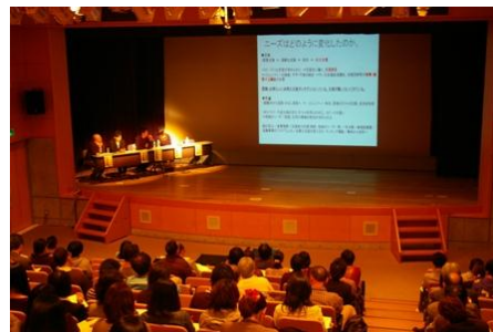
(左)つなプロ報告会@京都の様子

そのほか、各市町村つなプロへの情報提供、車両支援、マッチングリソースの紹介など、事務局・後方支援も続けています。