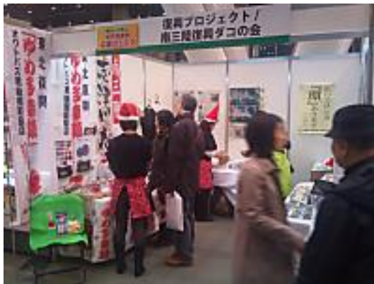
『被災地復興応援フェスタ』でのブース

また、入谷Yes工房の「オクトパスくん」のクリスマス・年末の販売のお手伝いとして、『被災地復興応援フェスタ』に参加し、首都圏の方々に向けて、オクトパス君の販売、このプロジェクトの意義、町の現状について伝えました。